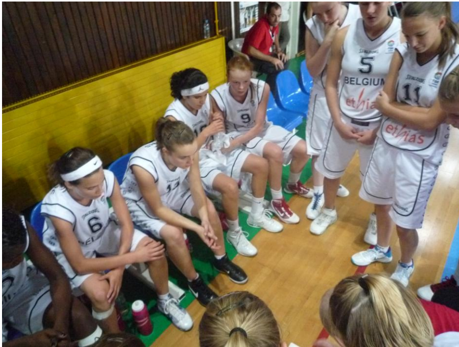
Een laatste time-out